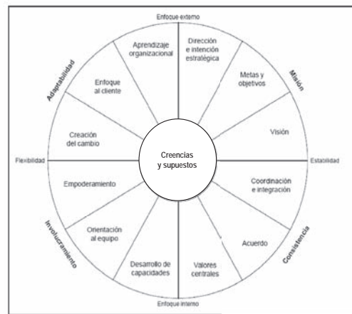
Figura 2. Modelo de Denison

Misión: se refiere al sentido claro de propósito o dirección que define las metas organizacionales y los objetivos estratégicos. Se expresa en la visión de lo que la organización quiere ser en el futuro. Sus dimensiones son: dirección e intención estratégica, metas y objetivos y visión.