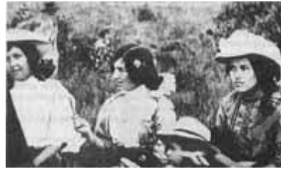
Traje femenino - Tame - 1915