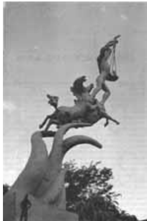
Monumento a los fundadores