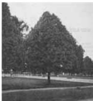
El ñambo, símbolo de la Amazonia

Los ríos principales son: Guaviare, Guayabero, Vaupés, Papunagua, Telaya, Inírida, Macaya, Itilla, Ajajú, Inilla, Miraflores, Los Perros, Caño Grande, Los Salados, Guaracú, Cachicamos y La Tigrera. Estas fuentes hídricas se caracterizan por tener sobresalientes raudales como los de Chiribiquete, Guayabero y Las Chulas. El raudal más importante es el del Guayabero que recoge el caudal del río en un paso rocoso muy angosto, lo que hace peligroso pasarlo en época de invierno. Su vecindad con la Serranía de La Macarena y los dibujos y petroglifos que hablan de una cultura precolombina desconocida, son atractivos para conocerlo.