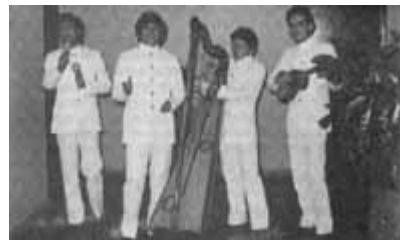
Centro Cultural llanero