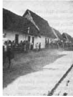
Casa antigua de pueblo