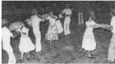
Baile de Joropo Antiguo

Los cantos, el baile del joropo; la carne asada y las hayacas; el coleo o toros coleados, son las más conocidas manifestaciones del folclor. No obstante, hay que tener presente los mitos, donde aparecen los duendes y espantos como la Bola de Fuego, el Silbón, la Mancarita que involucran las oraciones para librarse del mal; los ensalmes para mordidas de culebra y el empleo de plantas medicinales; el traje de faena pastoril; los vocablos regionales y el coplerío, la vivienda, y el trabajo, desde luego.