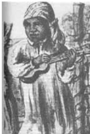
Sáliva - Tiple guagibero - 1850