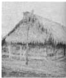
Sopro o casa ensoropada