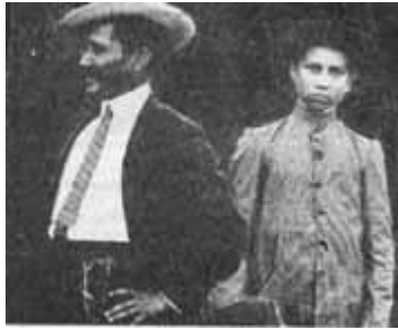
Trajes - Tame - 1915