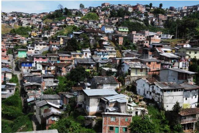
Barrio Marmato, en Manizales. La Patria.