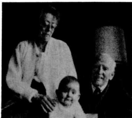
Lauchlin Currie con su esposa y su nieta.